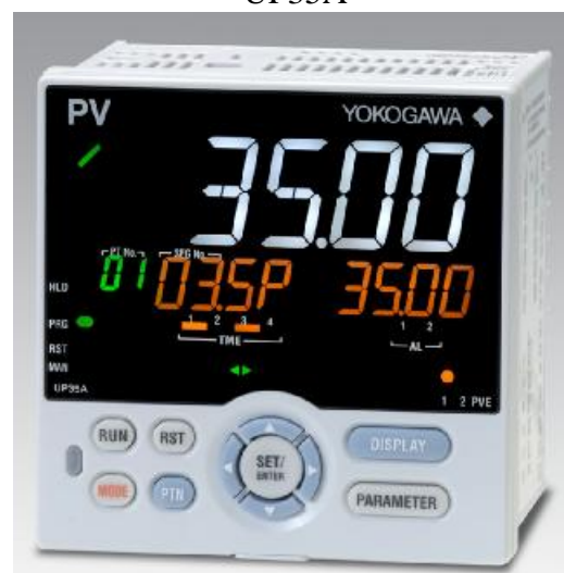
Рисунок 5 – фотографии общего вида контроллеров серий UP32A, UP35A