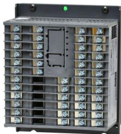
Рисунок 6 – фотографии общего вида контроллеров серий UT32A, UT35A, UT52A, UT55A с опцией /MDL