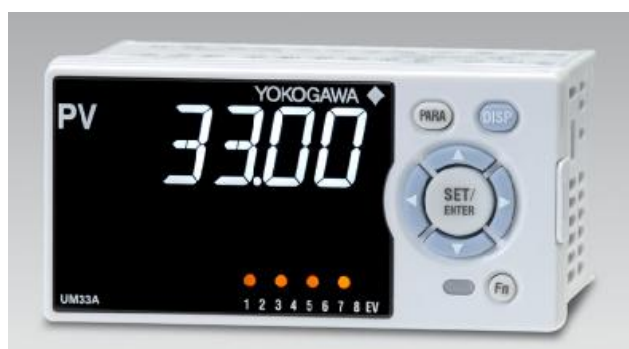
Рисунок 3 – фотографии общего вида контроллеров серии UM33A