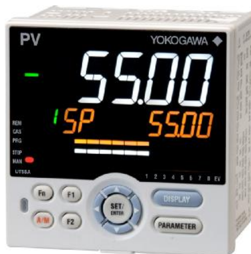
Рисунок 4 – фотографии общего вида контроллеров серий UT52A, UT55A