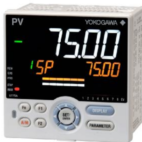
Рисунок 6 – фотографии общего вида контроллеров серий UP55A, UT75A