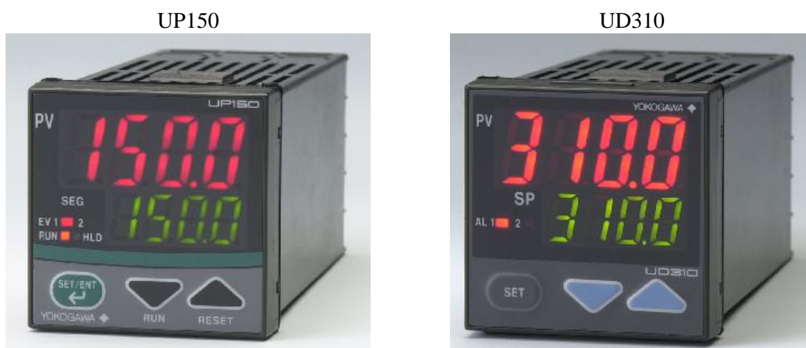
Рисунок 2 – фотографии общего вида контроллеров серий UP150, UD310