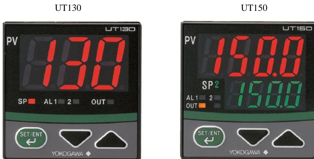
Рисунок 1 – фотографии общего вида контроллеров серий UT130, UT150

Фотографии контроллеров, места нанесения оттисков клейм или размещения наклеек представлены на рисунках 1 – 7.